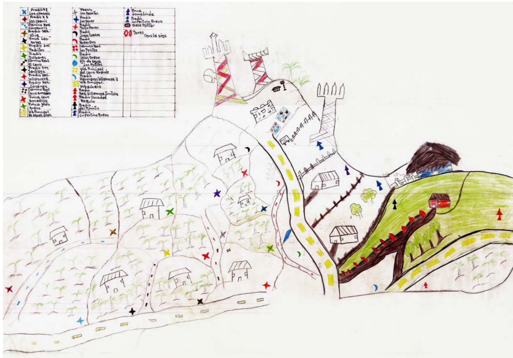
Distribución de predios productores de palma, Cerro de La Vieja, Piojón, Atlántico. Mapa Elaborado por Ismael Jiménez