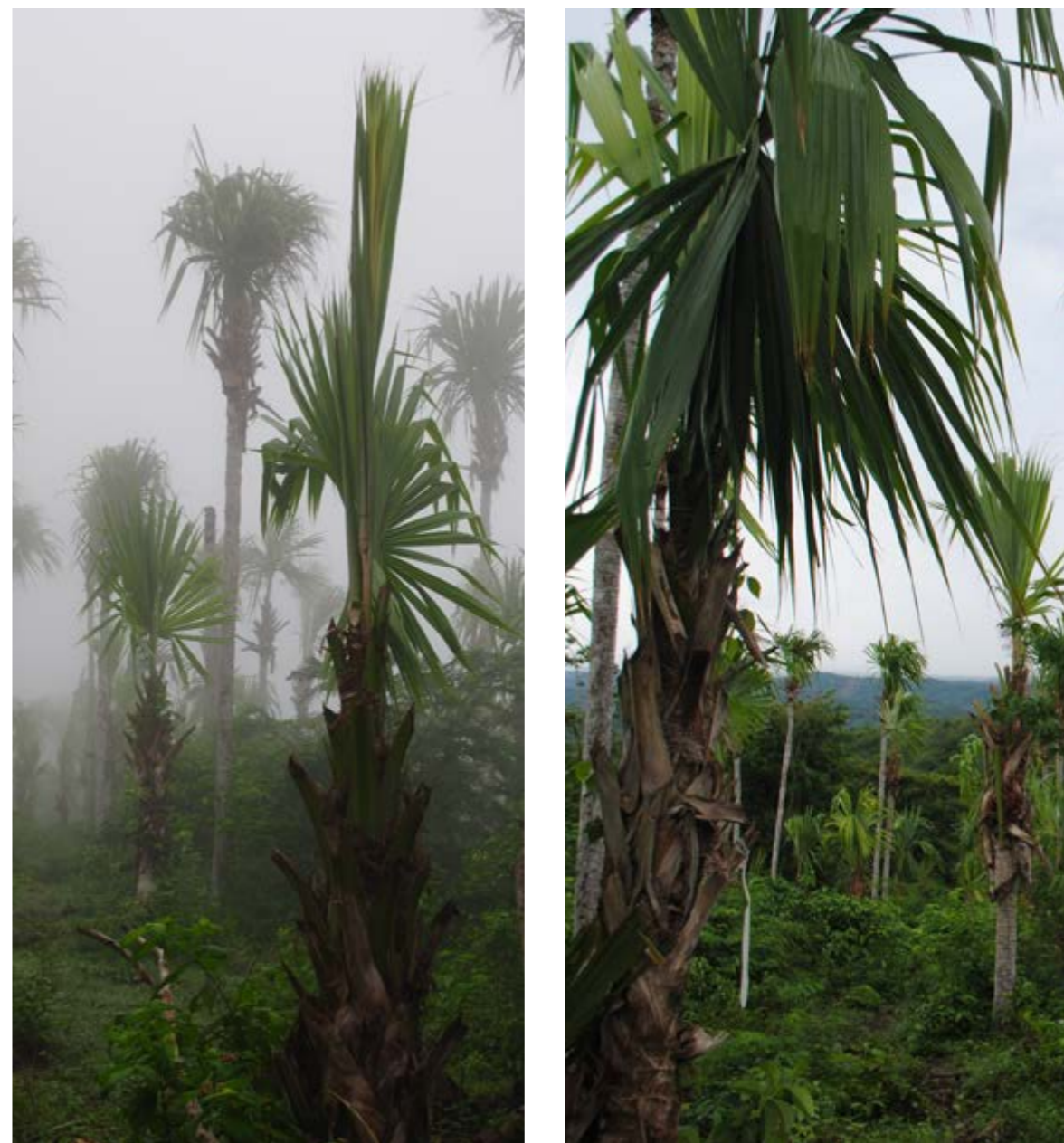
Figura 12. Aspecto de individuos de palma amarga en fincas con sobrecosecha de hojas.

que se mejoren las prácticas culturales, especialmente la relacionada con la quema, que es la práctica que parece tener un impacto más negativo en el mantenimiento de las poblaciones de palma amarga. Los sistemas de cultivo y rastrojo son más apropiados para el desarrollo de poblaciones saludables en términos de estructura, mientras que el sistema de ganadería, bajo el manejo actual, es el menos adecuado para el mantenimiento de las poblaciones, debido a que interfiere con su regeneración (Andrade & Galeano, 2015; Cudesac & Carsucre, 2007). El ganado impide el reclutamiento de nuevas plántulas y el impacto del pastoreo sobre la estructura poblacional es muchísimo mayor que el que podría generar la cosecha de hojas, debido a las altas tasas de mortalidad y a un efecto de retroceso hacia categorías de tamaño inferiores como resultado de la herbivoría y el pisoteo, tal como se ha señalado para otras especies (Endress et al., 2004a, 2004b).