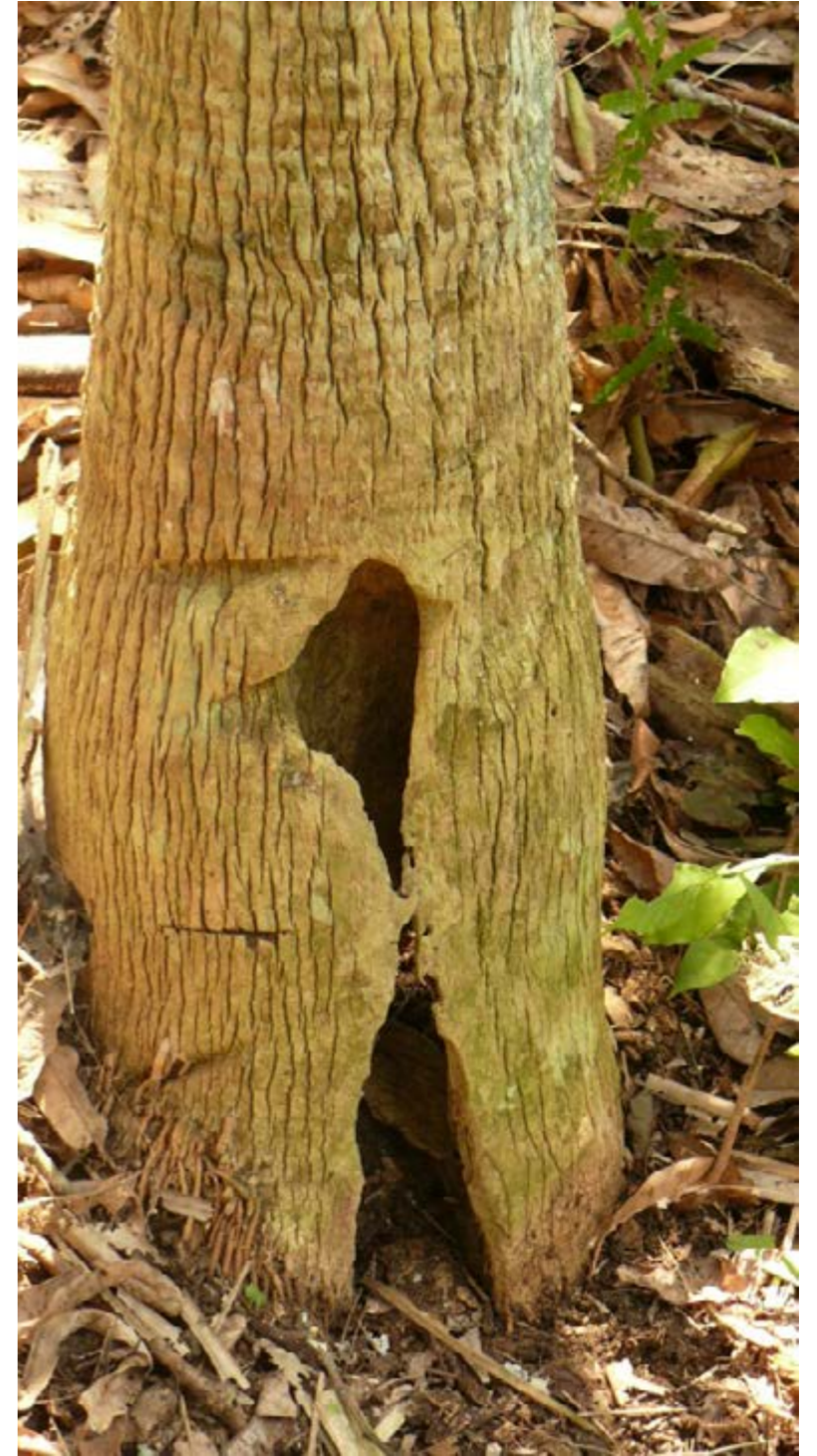
Figura 11. Troncos de palma amarga ( Sabal mauritiiformis ) con evidencias de quemaduras reiteradas y posterior ataque de termitas sobre el tejido muerto.