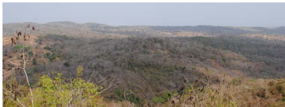
Figura 1. Paisajes en alrededores del municipio de Piojó que muestran los mosaicos de vegetación en una matriz de bosque seco tropical relictual fuertemente intervenido.

En general, los bosques y rastrojos altos como coberturas vegetales dominadas por árboles y arbustos se presentan a manera de pequeños manchones en medio de una matriz agrícola - ganadera, intensamente transformada, cultivada con maíz, mijo, ñame, yuca y pastos para bovinos.