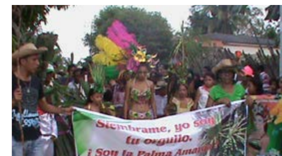
Figura 15. Bandera y escudo del municipio de Piojón donde se representa la fuerte relación sociocultural y emotiva que une a sus pobladores con la palma amarga. A la derecha, desfile en marco del Festival Cultural de la Palma Amarga. Abajo himno del municipio de Piojón.