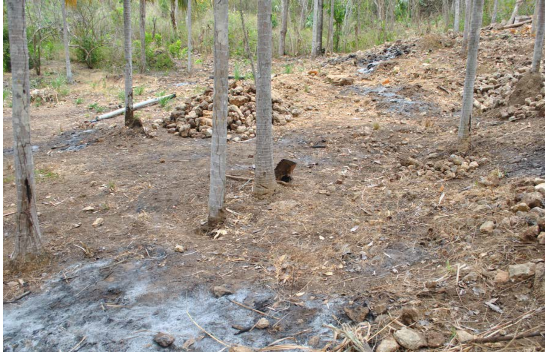
Figura 10. Método de tumba-roza-y-quema aplicado en una zona de producción agrícola con palma amarga en el municipio de Piojón, Atlántico.

y otra vez. Las cicatrices del fuego se aprecian en la base de la palma, que aparece a veces casi completamente ahuecada por efecto de las termitas que se alimentan del tejido muerto que resulta de las quemaduras, y la palma en ese punto es apenas un delgado cilindro de tejido exterior.