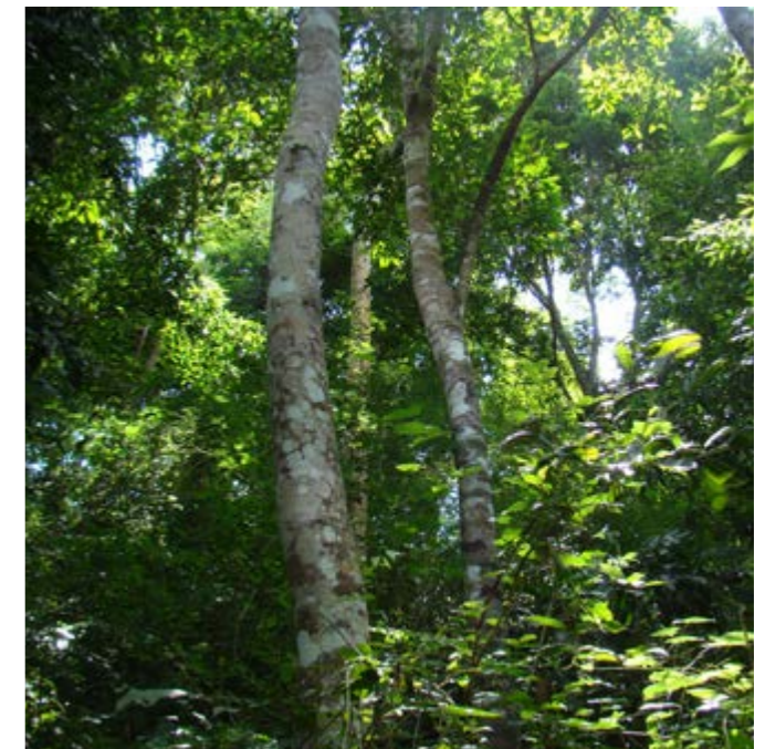
Figura 3. Aspecto general de los relictos de bosque seco tropical en el municipio de Piojé. Vista externa mostrando el alto grado de fragmentación y vista interna mostrando la diversidad vegetal en las zonas de mayor conservación.