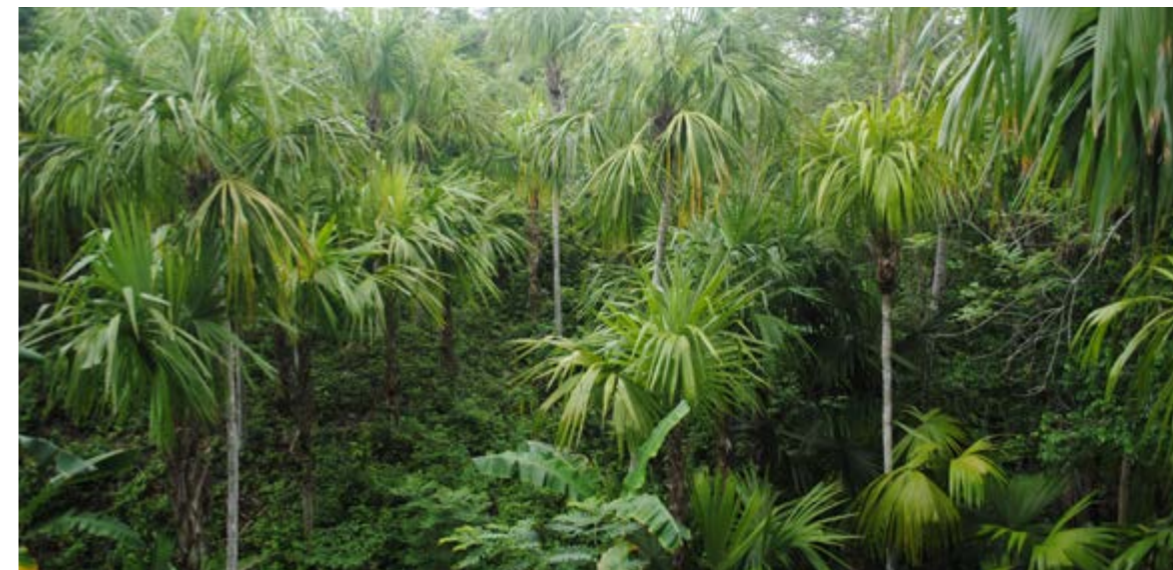
Figura 17. Cerro de la Vieja en Piojé. Vista externa e interna.

Se propone evaluar la posibilidad de incluir algún tipo de manejo especial para algunas áreas en donde aún hay poblaciones, como ocurre en el Cerro de la Vieja, una de las zonas con mejores poblaciones de palma amarga