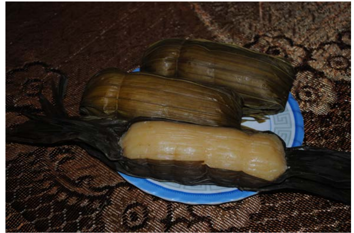
Figura 14. Bollos de yuca en su tradicional envoltorio con hojas de individuos jóvenes de palma amarga en una casa de Piojé.

integrados a los sistemas productivos agrícolas o ganaderos de la zona (Andrade-Eraza & Galeano 2015). Esta es una condición que no se ha observado para ninguna otra especie de palma en Colombia e indica un incipiente manejo agrosilvopastoril.