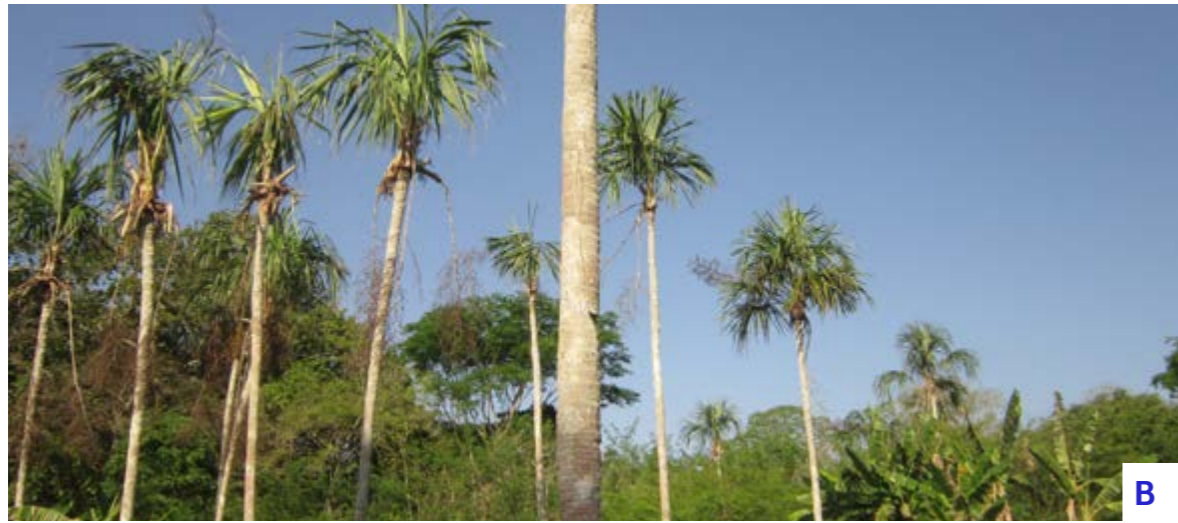
Figura 4. Sabal mauritiiformis . D, palma con inflorescencia; E, flores; F, infrutescencia madura; G, semilla germinada; H, juvenil; I, subadultos.