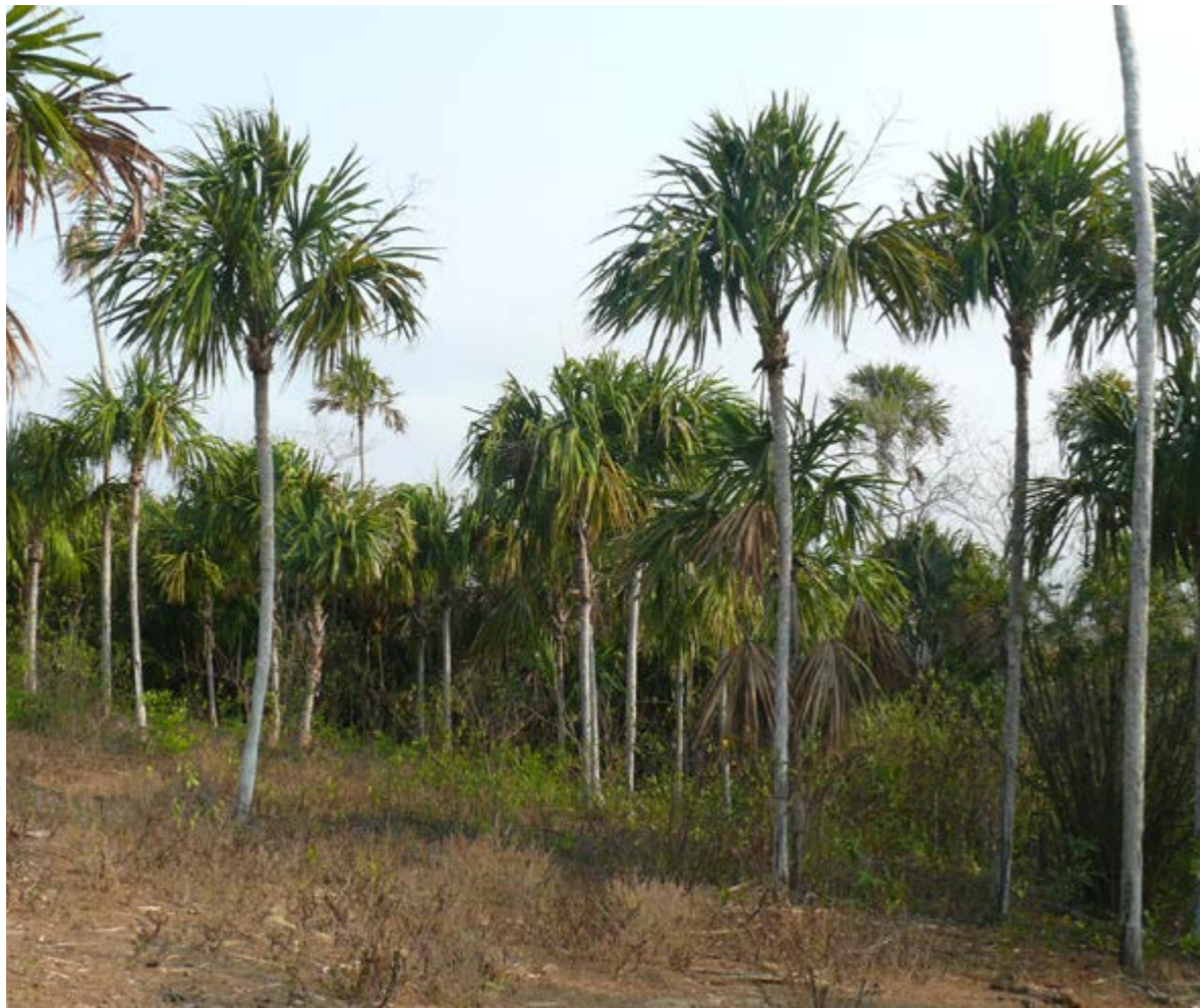
Figura 2. Paisajes agroforestales con manejo de palma amarga en sectores de cobertura original de bosque seco tropical. (Piojé, Atlántico)