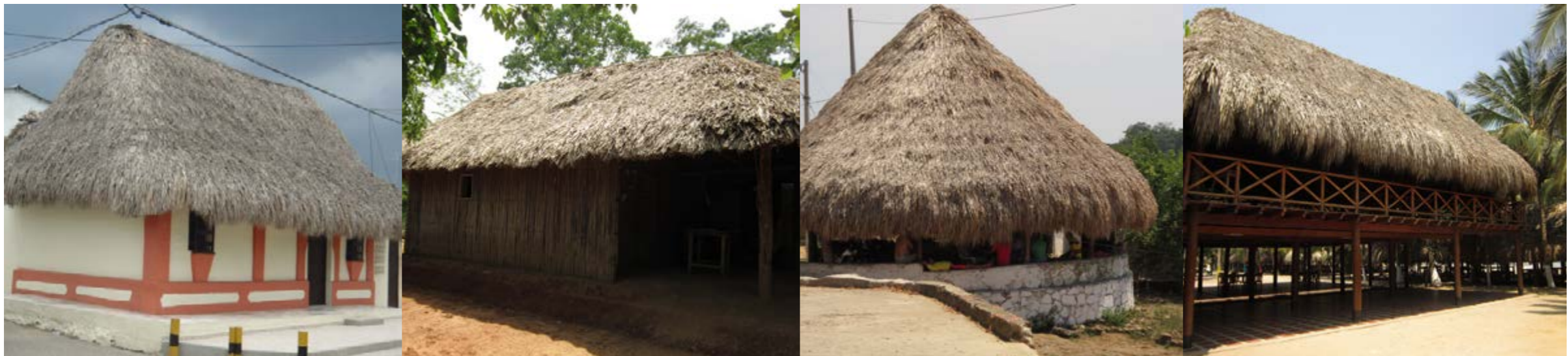
Figura 8. Diferentes tipos de estructuras con techos de palma amarga. Arriba: Casas de habitación. Abajo: Quioscos.

compuesta por cinco tipos de actores principales: los productores de hoja, los cosechadores, los comercializadores, los empajadores y los usuarios. Los productores usualmente cosechan todas las palmas de su propiedad en forma semestral o anual y hay algunas pocas excepciones de personas que llevan a cabo esta actividad tres o cuatro veces por año o algunos otros que dejan pasar más de un año sin cosechar las palmas. En todos los casos, la unidad de comercialización tradicional es el “mil de hojas”; así el productor paga al cosechador 100.000 pesos por el corte y arreglo de 1000 hojas, las cuales vende por 350.000 pesos (cifras para el año 2014; Andrade-Erao et al., 2015b).