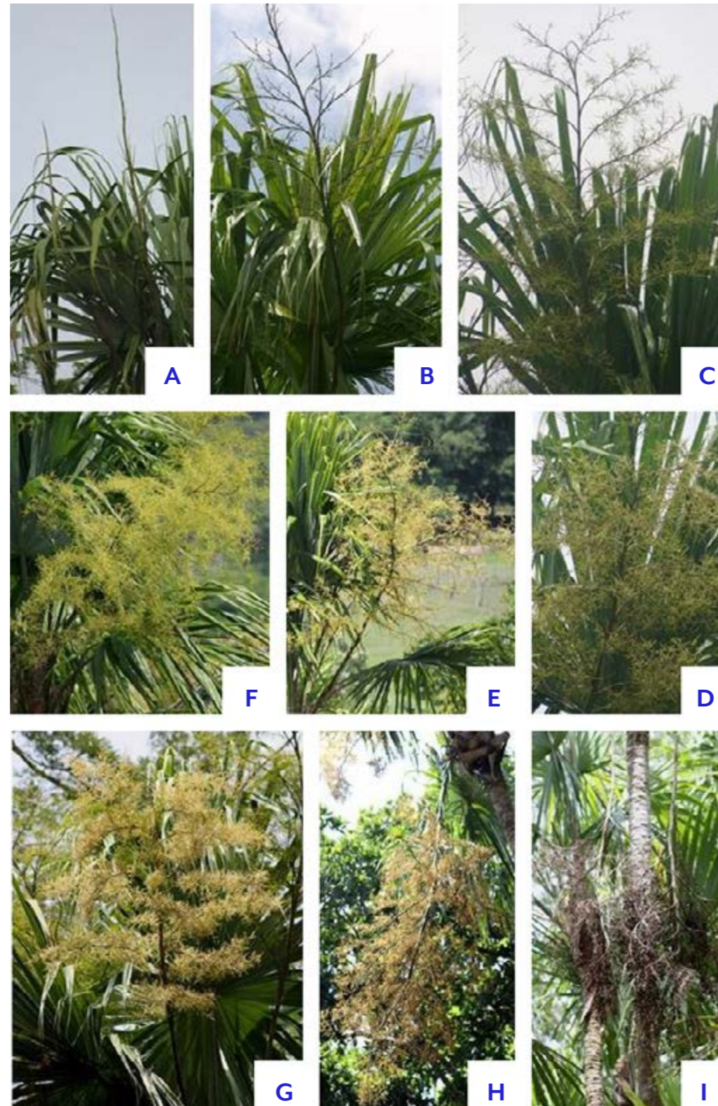
Figura 7. Fases de desarrollo de una inflorescencia de Sabal mauritiiiformis . A, yema; B, expansión de las primeras ramas; C-E, apertura de las flores; F-H, desarrollo de los frutos; I, frutos maduros (Tomado de Brieva-Oviedo & Núñez, 2015).

La palma amarga es una planta muy plástica y resistente, capaz de mantenerse en condiciones de disturbio y por eso ha sido posible que persista en el Caribe en diferentes tipos de uso de la tierra, a pesar de que su hábitat nativo casi ha desaparecido (Andrade-Erao & Galeano, 2015) (Fig. 6). El reiterativo método de tumba-roza-y-quema, que ha prevalecido en la transformación del hábitat y que acompaña los procesos productivos en la mayor parte del Caribe colombiano, ha diezariado casi todas las especies propias de los bosques secos de la región, con excepción de unas pocas, entre las que sobresale la palma amarga. Luego de la limpieza de los terrenos a machete o con herbicidas y quemas, las plántulas y los juveniles más pequeños usualmente mueren, mientras que los subadultos y adultos generalmente logran sobrevivir. En estas áreas productivas la palma amarga logra sobrevivir silvestre, en densidades y estructuras variables, dependiendo de si se trata de áreas de cultivos,