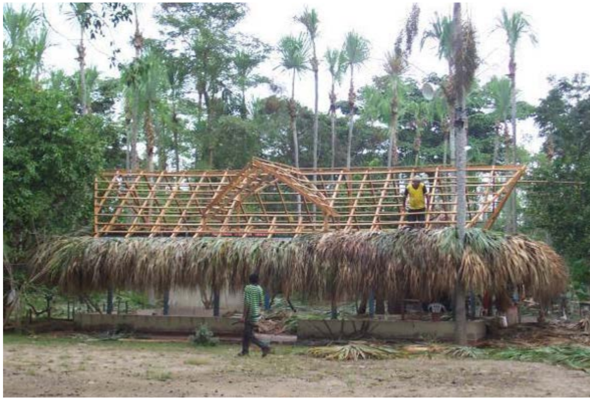
Figura 13. Momento de empaje de una casa comunitaria con hojas de palma amarga en el departamento de Sucre.