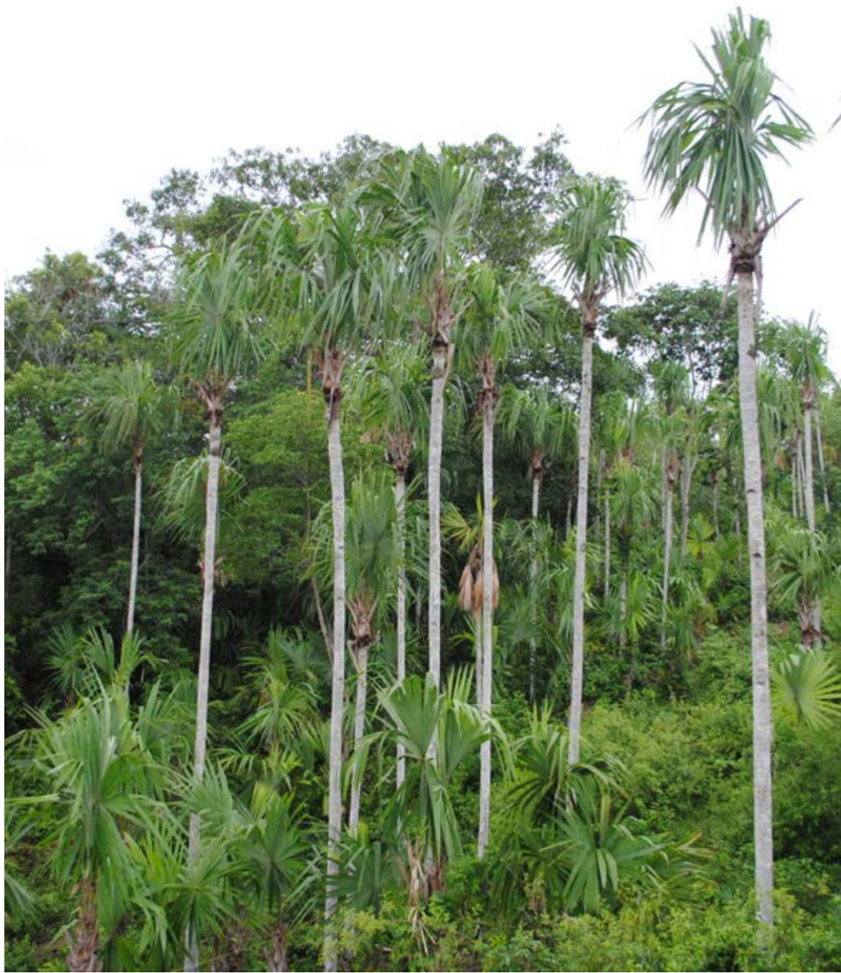
Figura 16. Paisaje agroforestal dominado por palmares de S. mauritiiformis , que muestra su particular belleza y potencial turístico.